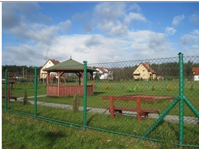
Plac zabaw 2010