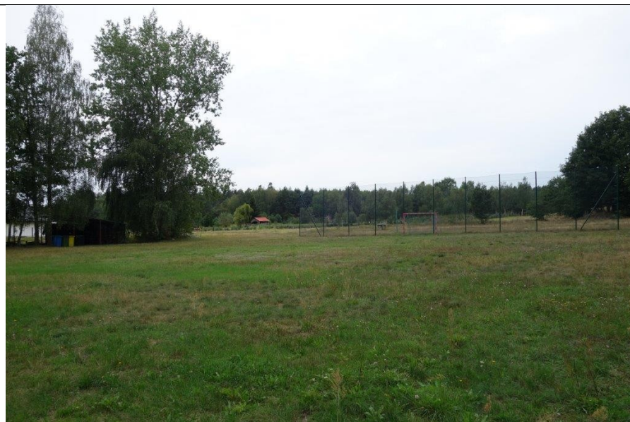
Boisko wiejskie rok 2020