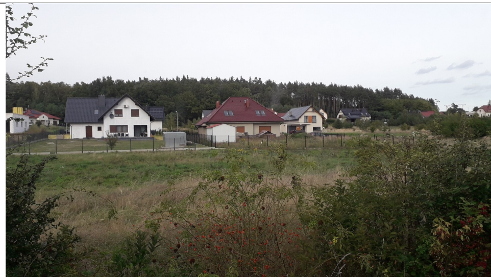
Nowe osiedle rok 2020