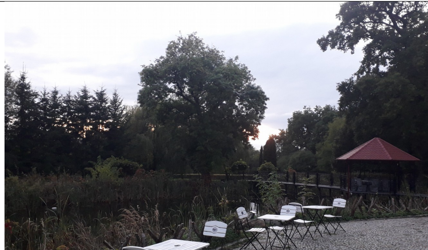
Otoczenie pałacu rok 2020