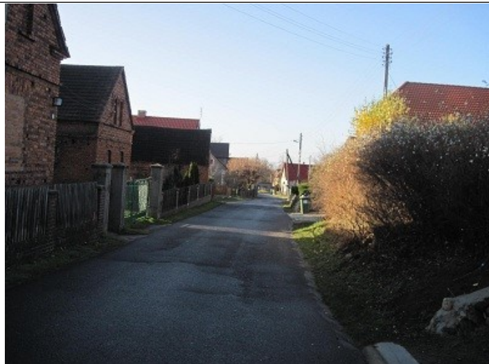
Stara część wsi rok 2010