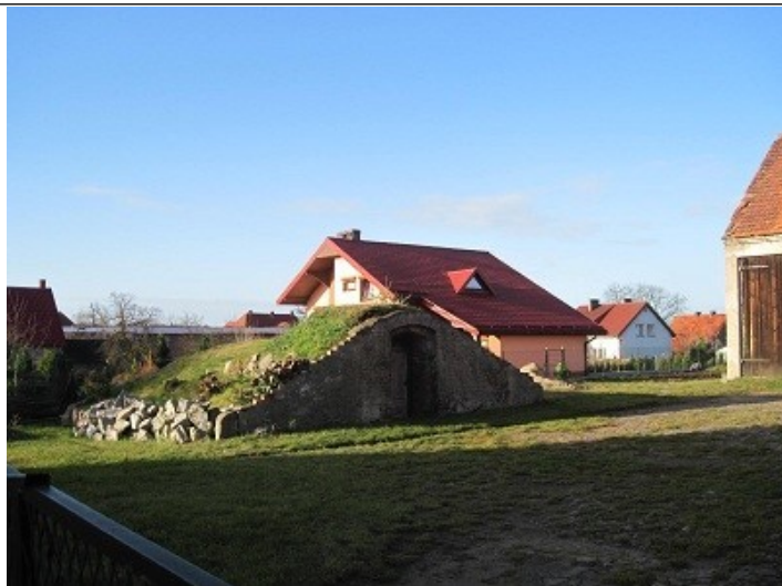
Oryginalna piwnica rok 2010