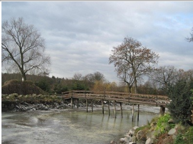
Otoczenie pałacu rok 2010