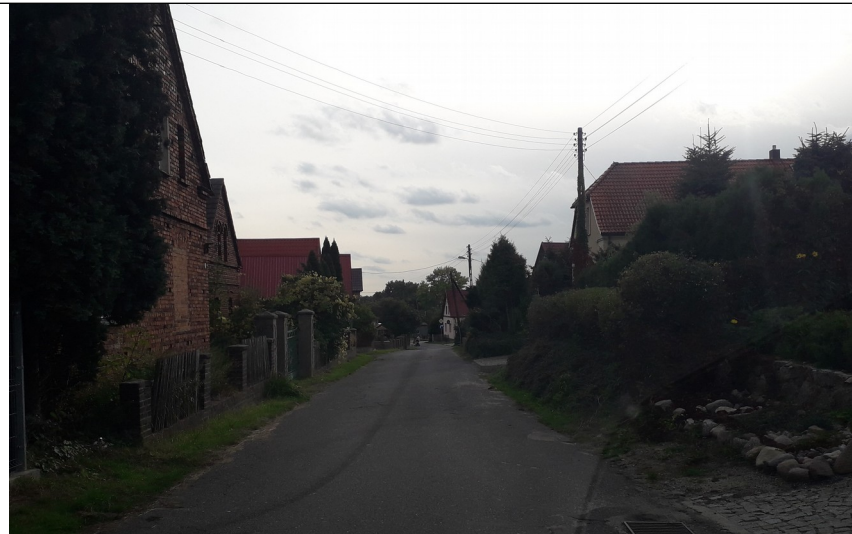
Stara część wsi rok 2020