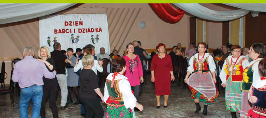
Dzień Babci i Dziadka w Jaczowie