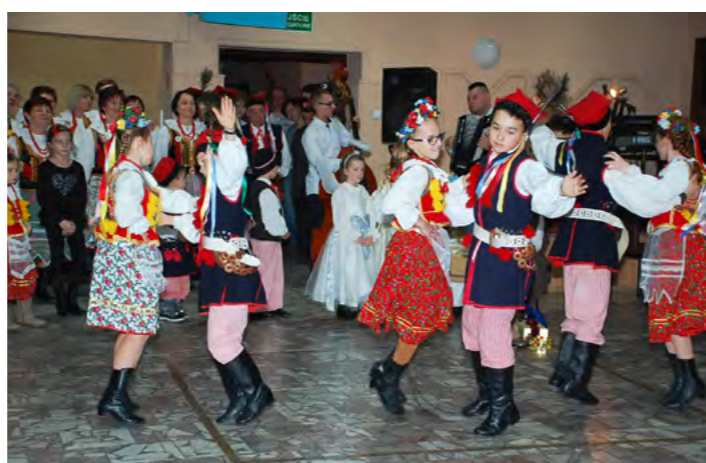
Jaczowskie pociechy zatańczyły swoim babciom i dziadkom krakowiaka