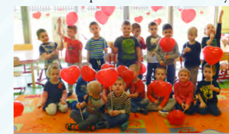
Walentynki w grupie 4-latków

Oprócz przedszkolnej codzienności od czasu do czasu placówka rozbrzmiewa muzyką,