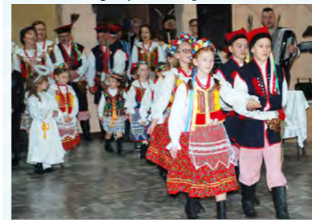
GCK prowadzi patronat nad działalnością Zespołu JACZOWIACY

Największym wyzwaniem pierwszych styczniowych dni było dopięcie spraw związanych z reorganizacją instytucji. Aneksowanie trwających umów, ustalanie regulaminów będących podstawą funkcjonowania jednostki, a także realizacja zobowiązań wynikających ze zmiany organizacyjnej GCK stanowiły priorytetowe zadania nowego dyrektora i pracowników.