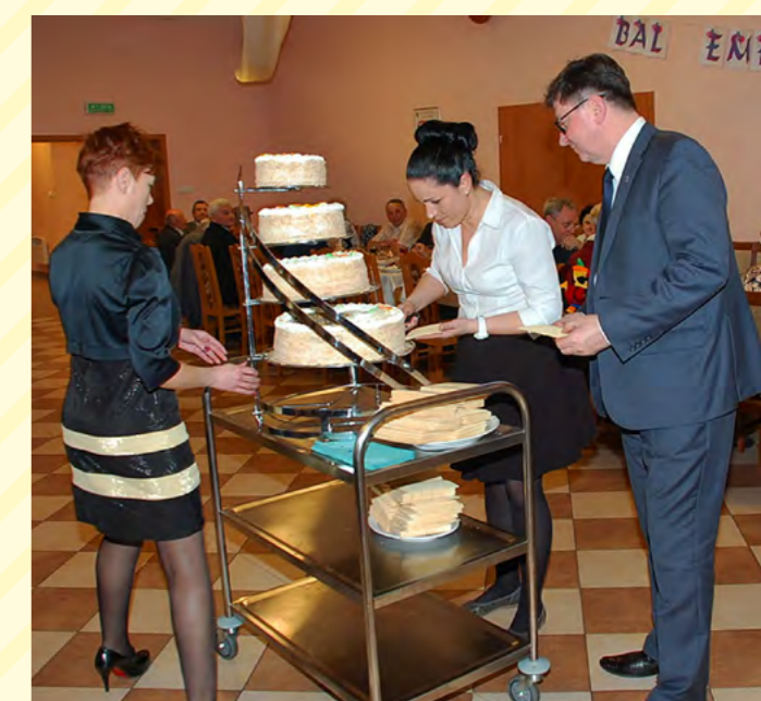
Niespodzianką był piętrowy tort