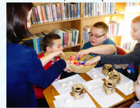
Podczas warsztatów wykonywania kraszanek organizowanych dla dzieci w bibliotece w Jerzmanowej

Od stycznia realizowane są zajęcia artystyczne i rękodzielnicze prowadzone przez instruktorków. W każdej ze świetlic wiejskich, a także w domach kultury i bibliotece prowadzone są