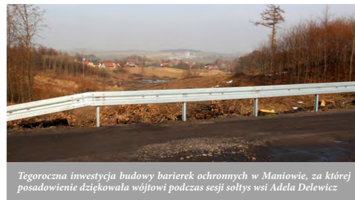
Tegoroczna inwestycja budowy barierek ochronnych w Maniowie, za której posadowanie dziękowała wójtowi podczas sesji sołtys wsi Adela Delewicz

Ponad 2,9 mln. zł władze samorządowe przeznaczyły na wydatki inwestycyjne w obszarze zadań związanych z kulturą i ochroną dziedzictwa narodowego. Na ten rok zaplanowano wykonanie remontu