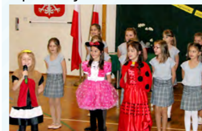
Taniec i śpiew wzbogaciły szkolną galę

Uczniowie Szkoły Podstawowej w Jerzmanowej, którzy osiągnęli w pierwszym semestrze najlepsze wyniki w nauce zostali nagrodzeni podczas apelu „Wzorowy Uczeń”.