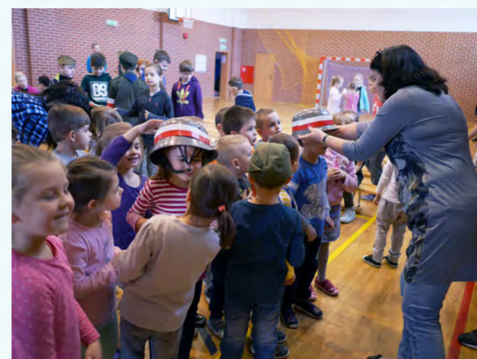
Przymierzeniem wojskowego helmu zainteresowane były także przedszkolaki