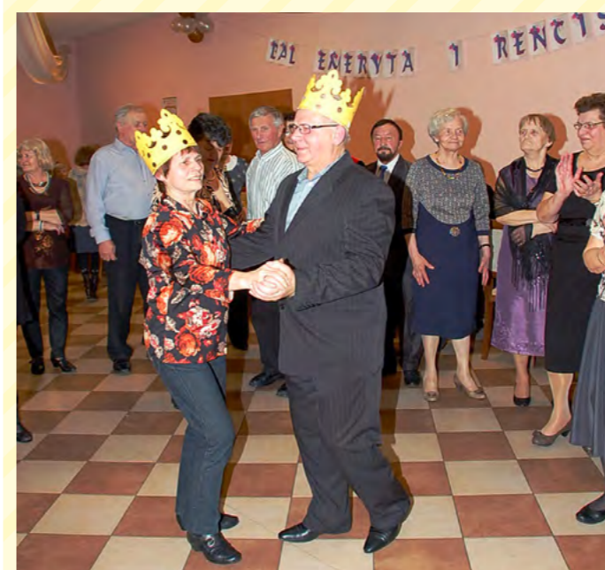
Pierwszy taniec królewskiej pary