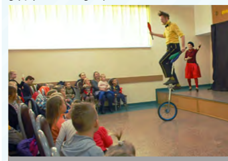
Nie żałował ten kto przyjął zaproszenie GCK na warsztaty cyrkowe