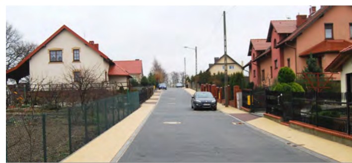
Wykonana inwestycja budowy drogi na ul. Stromej w Jaczowie

Budżet zaplanowany został tak, by znalazły się w nim inwestycje dotyczące różnych obszarów, o które samorząd gminny obowiązany jest dbać i wypełniać potrzeby społeczne. Gross zadań dotyczy budowy dróg publicznych, chodników oraz infrastruktury okołodrogowej. Ponad 6,6 mln zabezpieczono na inwestycje drogowe, w tym na przebudowę drogi nr 100512D wraz z odwodnieniem w Modłej, budowę drogi przebiegającej przez Maniów, budowę ulicy Wiosennej w Jaczowie, budowę chodnika w Potoczku i przy ul. Przemysłowej w Jerzmanowej. Przebudowany zostanie