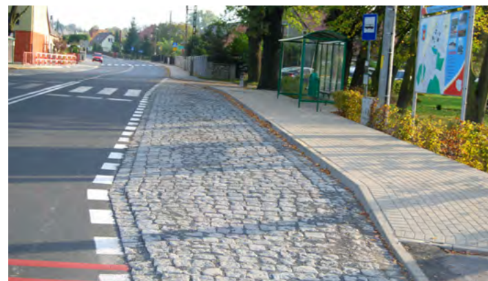
Zatoczki autobusowe to ważny element infrastruktury drogowej zwiększający bezpieczeństwo mieszkańców