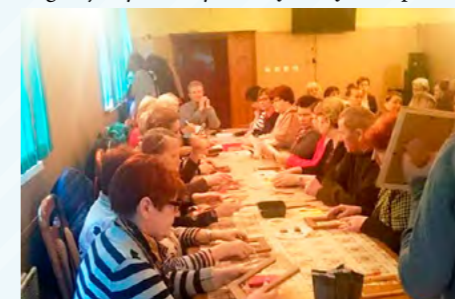
Warsztaty shabby chic w Kurowie Małym

Praca w instytucji kultury posiada swoją specyfikę, jest w ciągłym ruchu i nie przyjmuje stagnacji. By stworzyć dobrą ofertę GCK potrze-