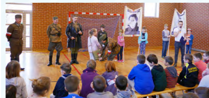
Dla uczniów klas IV - VI taka forma lekcji historii jest atrakcyjna i ciekawa