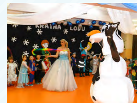
Tematem przewodnim balu karnawałowego była Kraina Lodu

tańcem i radością. Panie przygotowują piękne dekoracje i poczęstunek. Od wejścia zauważa się tu bajkową atmosferę, niecodzienne stroje. Świątuje się tu zgodnie z kalendarzem karnawału, Dzień Babci i Dziadka, Walentynki.