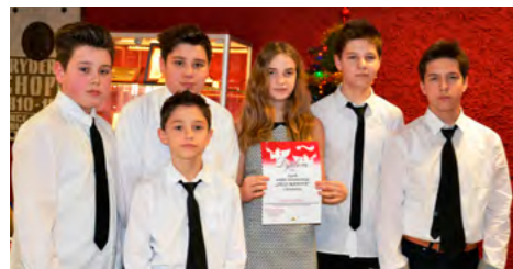
Zespół Jezzmanowa z dyplomem za udział w 22 Międzynarodowym Konkursie Kolęd i Pastoralek

Zespół JEZZMANOWA w muzycznej podróży po „polskiej mapie kolędowania” dojechał do finałowych przesłuchań Międzynarodowego Festiwalu Kolęd i Pastoralek w Będzinie.