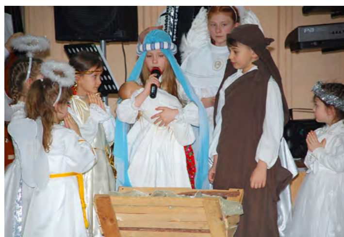
Jasełka w wykonaniu dzieci z Zespołu JACZOWIACY

Jako że uroczystości związane z Dniem Babci i Dziadka połączone ze spotkaniem oplatkowym, czas niedzielnego popołudnia wypełniły jasełka w wykonaniu Zespołu „Jaczowiaczy” oraz kolędy zaśpiewane przez głogowski chór „Za Tobą”. By przedłużyć miłe chwile spotkania, dla gości przygotowano wiele tanecznych kawalków oraz poczęstunek, o który zadbały panie z miejscowego KGW.