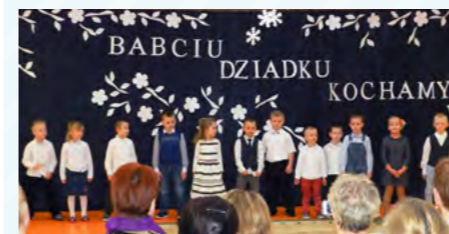
Przedszkolaki gościły ukochane babcie i dziadków

Przedszkole jest pierwszym etapem w edukacji dzieci. To co zostanie utrwalone i pokazane maluchom i starszakom ma szansę przetrwania przez kolejne lata ich dzieciństwa.