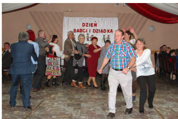
Zabawa na parkiecie – popularny „pociąg”