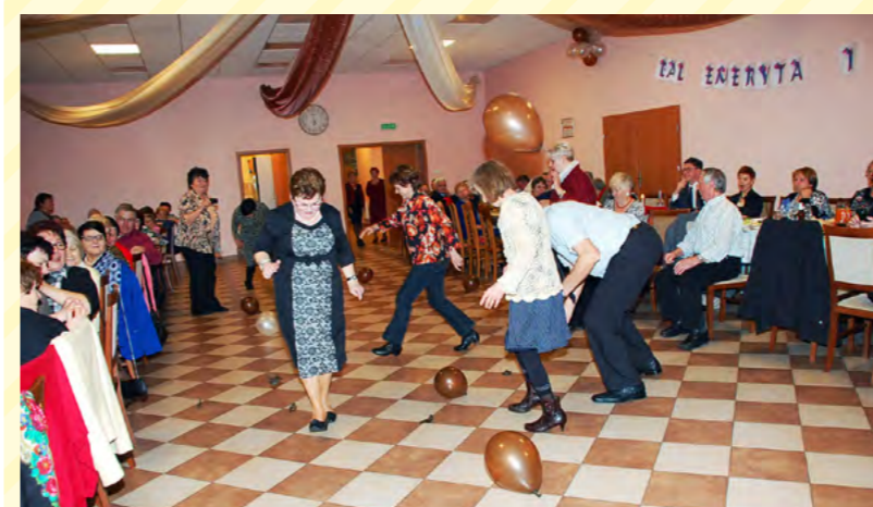
Wiele emocji dostarczył konkurs rozdeptywania balonów