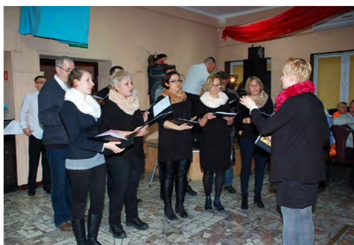
Kolędowanie w wykonaniu chóru „Za Tobą”