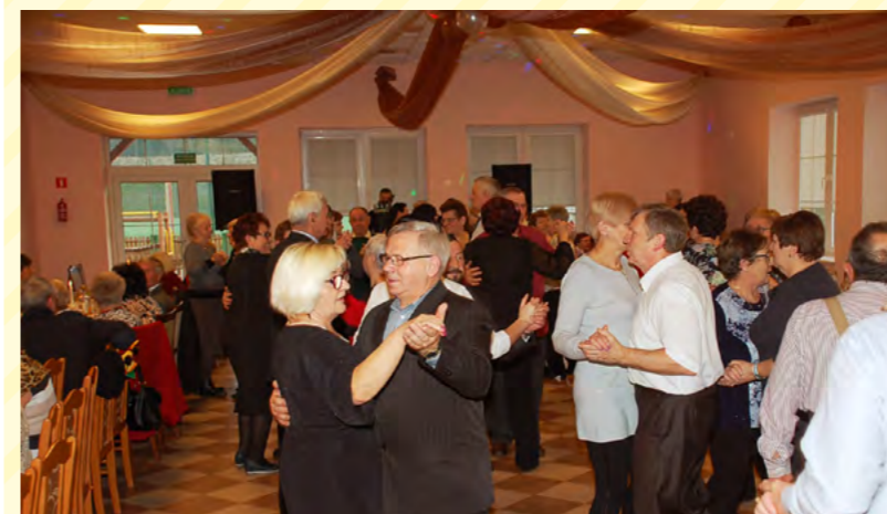
Dominowały tańce w parach, w grupkach oraz w kółeczkach

Jak przystało na bal jego głównym elementem były tańce. Seniorzy licznie zapełniali parkiet od początku imprezy aż po jej zakończeniu. Szaleństwem sprzyjała przestronna sala i komfortowe warunki do zabawy.