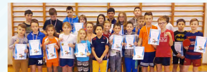
Triumfatorzy XVII Dolnośląskich Igrzysk LZS i Mieszkańców Wsi w Jerzmanowej