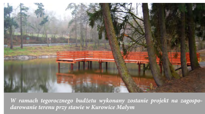
W ramach tegorocznego budżetu wykonany zostanie projekt na zagospodarowanie terenu przy stawie w Kurowice Małym

Zadbano także o infrastrukturę sportową i na ten cel przygotowano budżet przekraczający 439 tys. zł . Przy Publicznym Gminnym w Jerzmanowej przebudowane zostanie boisko, które od chwili powstania nie spełnia swojej roli ze względu na złą nawierzchnię. Boisko w Jaczowie wzbogaci się o instalację nawadniającą płytę, a boiska w Jerzmanowej i Łagoszowie Małym o barierki ochronne. W Gaikach wybudowane zostanie boisko wielofunkcyjne z nawierzchnią poliuretanową, a tereny rekreacyjne w Maniowie i Jerzmanowej wyposażone zostaną w urządzenia siłowni zewnętrznych.