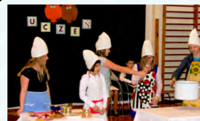
Uroczystość „Wzorowy uczeń” jest okazją do prezentacji różnych talentów, w tym także aktorskich