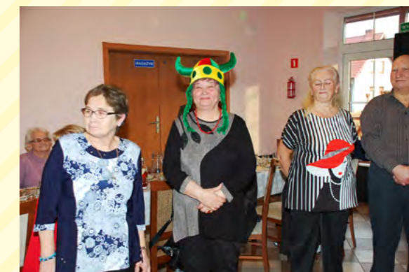
Podczas zabawy „Niespodzianka z worka”