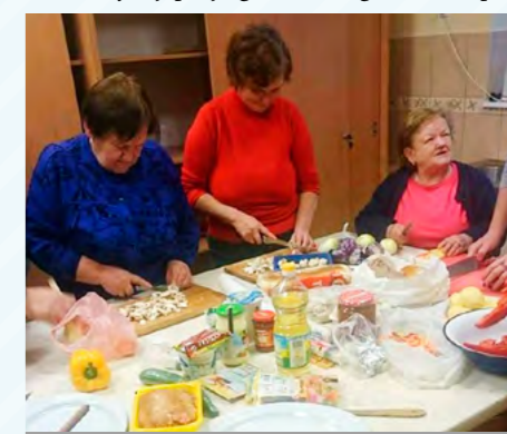
Zajęcia kulinarne w Maniowie

Przed GCK ogromne wyzwanie logistyczne – organizacyjne polegające na przygotowaniu pobytu gości, którzy wezmą udział w Światowych Dniach Młodzieży, a swoje spotkanie z Polską rozpoczną od gminy Jerzmanowa. Przewidujemy pobyt gości z Senegalu oraz z par-