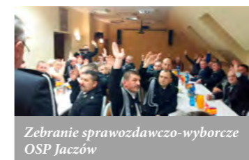
Zebrań sprawozdawczo-wyborcze OSP Jarczów

Zebrań były okazją do podziękowania naszym strażakom za ich służbę. Wójt dziękował wszystkim OSP, przedstawiciel Państwowej Straży Państwowej w Głogowie, zaangażowanie w jakim podchodzą do służby i przygotowaniu do zawodów sportowo-pożarniczych oraz pomoc przy organizacji różnego rodzaju imprez gminnych.