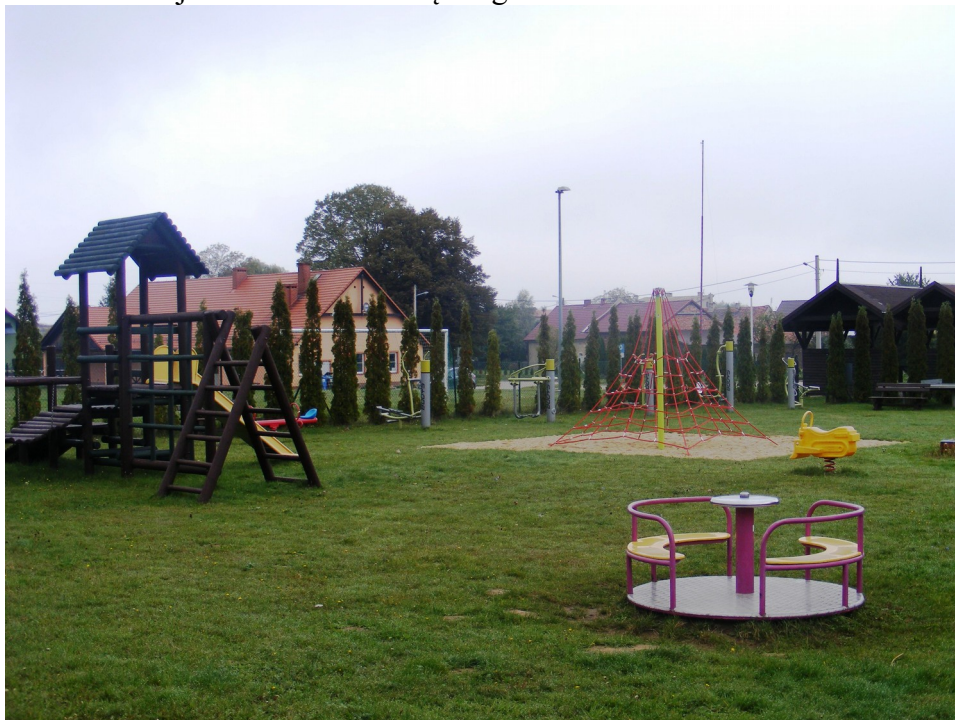
6. Plac zabaw z siłownią zewnętrzną