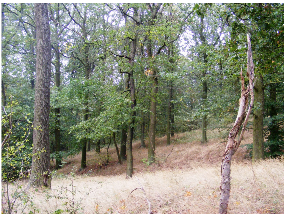
7. Las w pobliżu Smardzowa