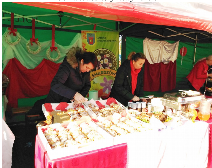
10. Stoisko solectwa przygotowane przez KGW w Smardzowie – BIEG GĘSI 11 listopada 2019r.