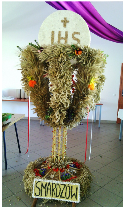
9. Wieniec dożynkowy 2016r.