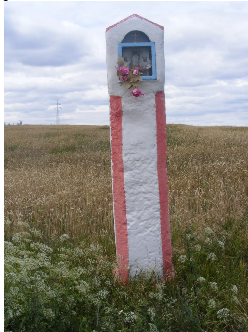
3. Kapliczka w centrum wsi i kapliczka pokutny