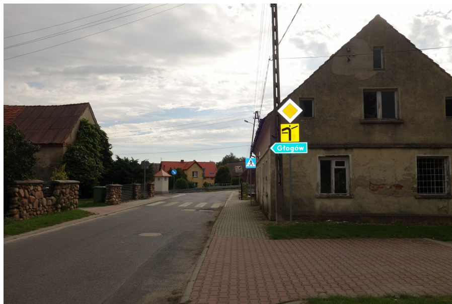
11. Ulica Smardzowa