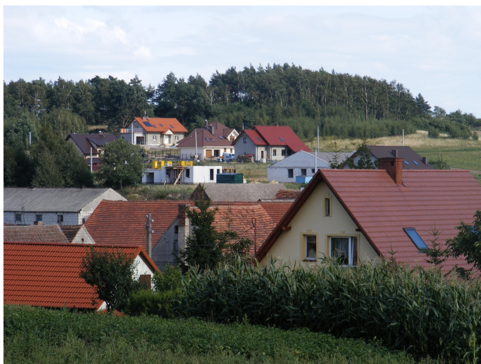
2. Widok na nowo powstające domy