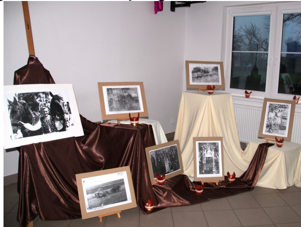
8. Wieczór wspomnień w świetlicy wiejskiej – 2014r.