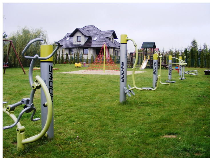
5. Plac zabaw z siłownią zewnętrzną