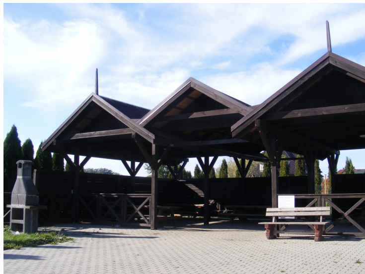
4. Wiaty piknikowe