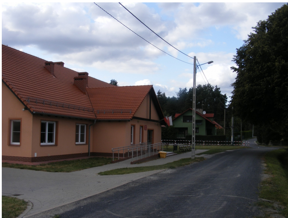
1. Świetlica wiejska