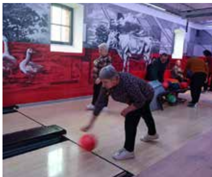
Kręgle w Stodole Kultury