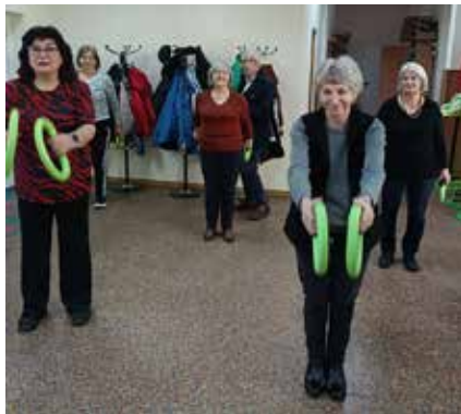
Zajęcia z gimnastyki