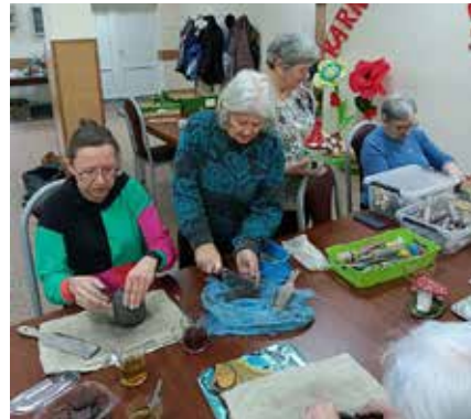
Warsztaty z ceramiką