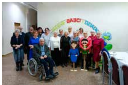
20.01.2023 r. Dzień Babci i Dziadka w Klubie Seniora w Jerzmanowej. Na zdjęciu Uczestnicy Klubu

Seniorzy jednogłośnie dziś przyznają, że Klub zamienił ich życie w „aktywne i sprawne”. Tak jak wybrzmiewa tytuł projektu, który dostrzec można już w korytarzu przy wejściu do Klubu, na plakacie informacyjnym. Z daleka widnieją też unijne logotypy.