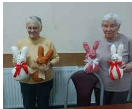
Warsztaty z ceramiką

Członkowie Klubu mają zajęcia pięć razy w tygodniu od godziny 9 do 14. Podczas zajęć otrzymują ciepły posiłek, a zajęcia mają formę dobrowolną. Nie są to lekcje jak w szkole, choć seniorzy nie ukrywają, że początkowo trudno było im się przyzwyczaić do nowego obowiązku i pogodzić go z życiem codziennym. Jednak jest to możliwe i dziś chętnie wstają rano i cieszą się na myśl o tym, że spotkają swoich rówieśników, często sąsiadów z innej ulicy czy z sąsiedniej miejscowości, z którymi nie mieli takiego kontaktu jak teraz, gdy funkcjonuje Klub.