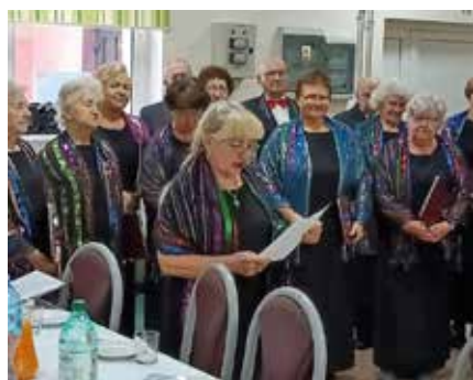
R. Jedut. 2 Chór „GAUDIUM” z Głogowa