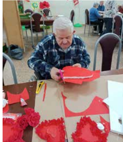
Dekoracje na Bal Walentynkowy

Idea powstania Klubu była pomysłem Gminnego Ośrodka Pomocy Społecznej w Jerzmanowej, która po sukcesie Klubu seniora w Maniowie, postanowiła utworzyć kolejny. Tym razem do współpracy zaprosiła organizację pozarządową, która aktywnie działa w regionie – Fundację Przedsiębiorczości Społecznej z Głogowa. Wspólnie złożony projekt do Dolnośląskiego Wojewódzkiego Urzędu Pracy spotkał się z uznaniem ekspertów i Gmina Jerzmanowa otrzymała środki na jego realizację z realizowanego w ramach Regionalnego Programu Operacyjnego Województwa Dolnośląskiego na lata 2014-2020 (RPO WD 2014-2020), Oś Priorytetowa 9 Włączenie społeczne, Działania 9.2 Dostęp