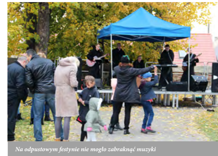
Na odpustowym festynie nie mogło zabraknąć muzyki

Koncert oprócz ogromnych walorów muzycznych wniósł wiele cennych wartości edukacyjnych. Zespół zaprezentował zabytki polskiej muzyki sakralnej, religijnej i liturgicznej. Podczas występu można było usłyszeć dzieła znane dotąd wyłącznie wąskiemu gronu specjalistów, odnalezione w polskich archiwach i bibliotekach. Zaśpiewane w wielo-