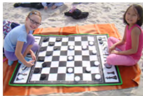
Zabawy na piasku