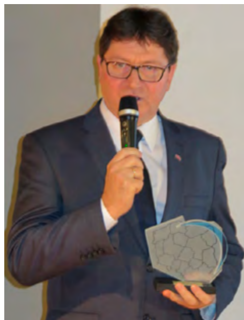
Tytuł Lidera Rozwoju Regionalnego 2015 to potwierdzenie dobrze realizowanej polityki inwestycyjnej (fot. K. Orzechowski)

III Polski Kongres Przedsiębiorczości to jedna z nielicznych w Polsce imprez umożliwiających spotkanie środowisk naukowych, gospodarczych i społecznych. Kongresowi towarzyszyło kilkadzie-