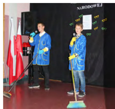
Problemy współczesnej szkoły poruszali w swoich skeczach uczniowie gimnazjum

Myśl tę kontynuował w swoich wystąpieniach wójt, który uczestniczył w uroczystościach z okazji DEN we wszystkich placówkach oświatowych i podkreślał ogromny wkład pracy nauczycieli i pracowników niepedagogicznych w codzienne funkcjonowanie tych jednostek. Cieszy mnie to, że w naszych szkołach jest tak ludzkie podejście zarówno do nauczania jak i pobierania nauki. Chcemy więc wspólnie dążyć do tego by byli tu naprawdę wyśmienite wypięki, by w świat wyruszyli z naszych szkół dobrze przygotowani, zaopatrzeni w wiedzę, radzący sobie z trudnościami uczniowie – podkreślał wójt.