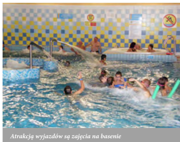
Atrakcją wyjazdów są zajęcia na basenie