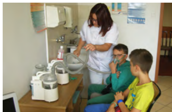
Ważnym aspektem wyjazdów na zieloną szkołę jest profilaktyka zdrowotna – uczniowie podczas inhalacji solankowych