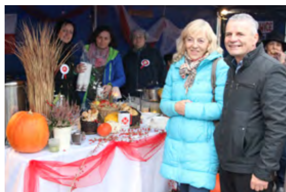
Stoiska cieszyły się ogromną popularnością uczestników Święta Niepodległości

Tłumy zgromadził pokazowy show kulinarny Okrasy, który przygotował sałatkę i marynowane piersi z gęsi, opiekane na sianie oraz zupę dyniową z dodatkami. Zanim zabrał się do przygotowania dań krasomówco oddawał się temu co tak naprawdę bardzo lubi: opowieściom o smakach, często nawiązujących do dzieciństwa i lat spędzonych na wsi, o cennych przyprawach, kulinarnych mariażach, wreszcie o esencji przygotowywania posiłków. Degustacja jego potraw nie zawsze trafiała w podniebienia ale była czymś nowym i łatwym do powielenia.