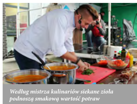
Według mistrza kulinarów siekane zioła podnoszą smakową wartość potraw

na nagrodę rzeczową, drugie miejsce zajęło sołectwo Kurowice, a wyróżnienia otrzymały sołectwa: Maniów, Potoczek i Bądzów.