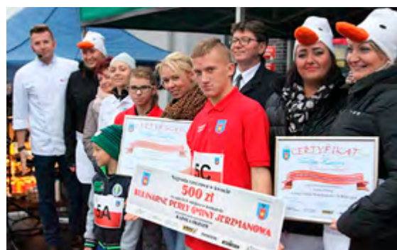
Zwycięzili młodzi adepci kulinarniej sztuki z Zofiówki, drugie miejsce zajęło sołectwo Kurowice