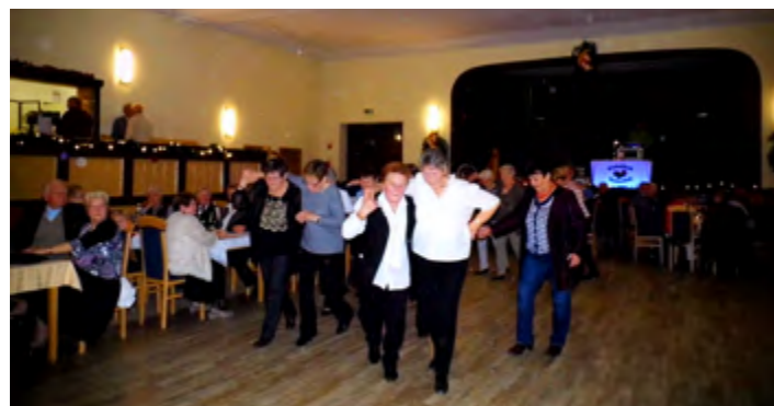
Seniorzy wypełnili parkiet podczas dyskotekowych rytmów