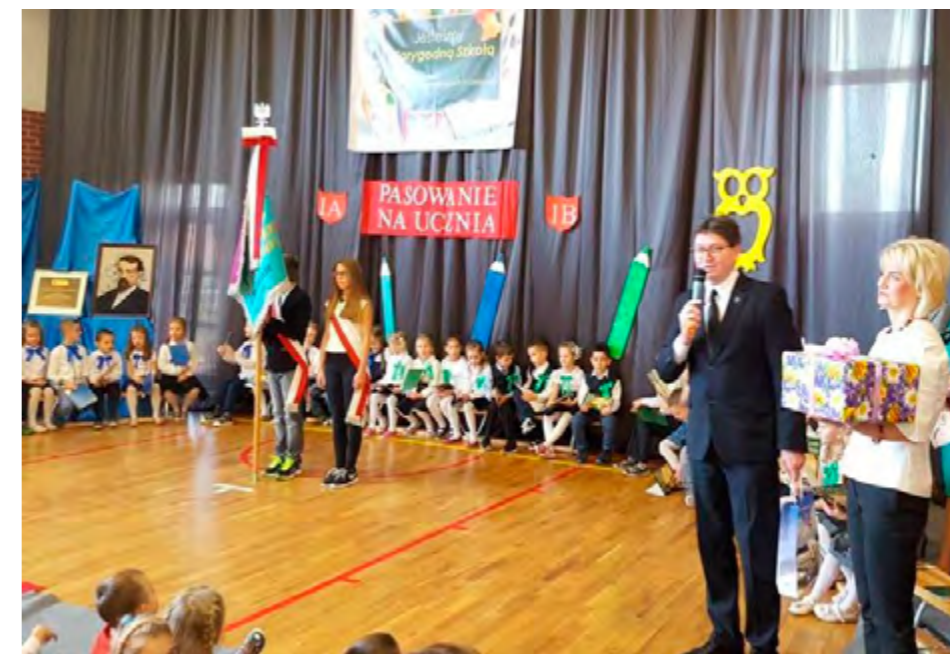
Wójt przekazał szkole gratulacje oraz okolicznościowy prezent

„Do szopy hej pasterze, do szopy bo tam cud...”