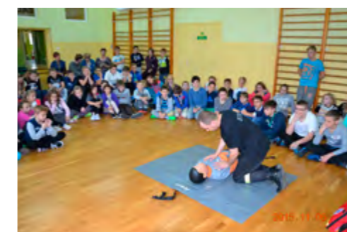
Zajęcia udzielania pierwszej pomocy w Szkole Podstawowej w Jerzmanowej

Misją strażaków ochotników z Jaszowa, oprócz udziału w akcjach ratowniczych jest przekazywanie wiedzy przydatnej każdemu człowiekowi. Zdobyli niezbędne kwalifikacje, brali udział w kursach ratownictwa przedmedycznego lecz do szkolenia innych osób brakowało sprzętu. I właśnie dzięki programowi „Działaj Lokalnie” Porozumienia Wzgórz Dalkowskich mogli zrealizować swój projekt „Mały Ratownik”. Projekt współfinansowany został także przez Związek Gmin Zagłębia Miedziowego.