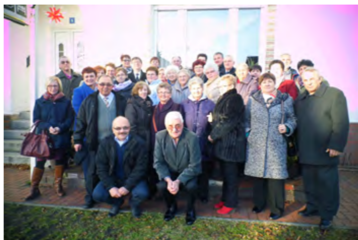
Seniorzy reprezentujący 12 sołectw gminy Jerzmanowa

W spotkaniu (10.12.) wzięło udział 30 seniorów z Polski, którym gmina zapewniła wygodny transport i ubezpieczenie. Spotkanie z nie-