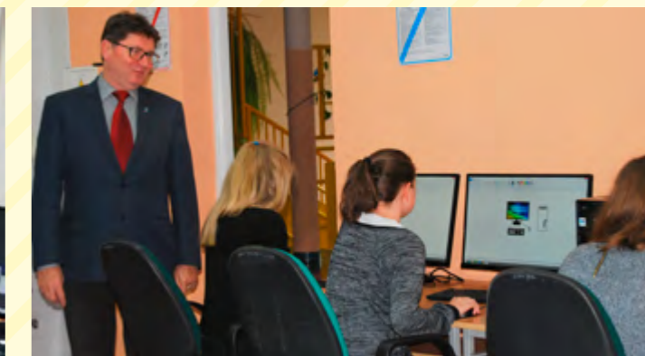
Wójt podczas odbioru pracowni komputerowej