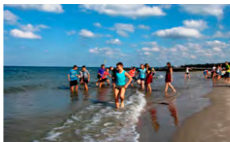
Aktywność fizyczna sprzyjała hartowaniu młodych organizmów