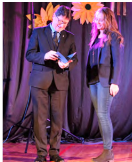
Stypendia naukowe otrzymali także najzdolniejsi studenci