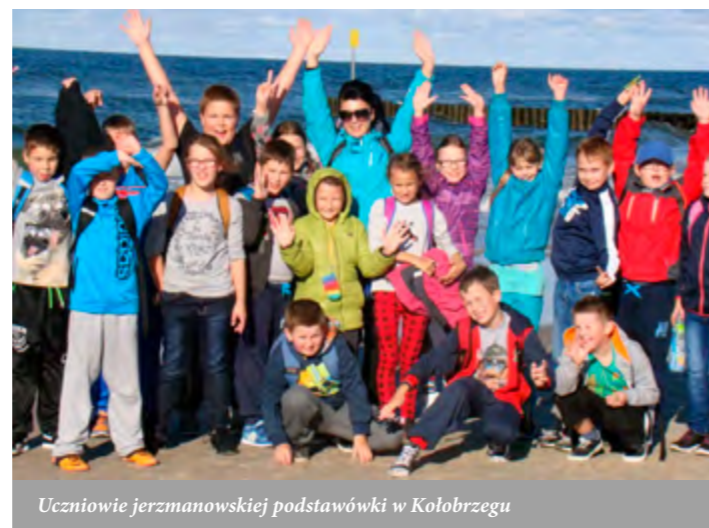
Uczniowie jerzmanowskiej podstawówki w Kołobrzegu

o trudnej sytuacji materialnej, których nie stać na zapewnienie jakiegokolwiek wypoczynku wyjazdowego, szczególnie nad morzem. My umożliwiamy wyjazdy uczniom nieodpłatnie. Całościowy koszt projektu to 139.024 zł, z czego 131.040 zł to środki pozyskane przez gminę z Fundacji KGHM Polska Miedź.