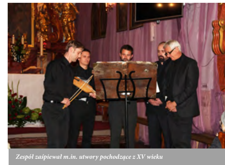
Zespół zaśpiewał m.in. utwory pochodzące z XV wieku

głosie utwory pochodzące z XV-XVI w.: o św. Zygmuncie (wg polskiego rękopisu z Płocka), Bogurodzica (z końca XVw.), pieśni wielkanocne czy utwory z repertuaru ludowego tzw. pustych nocy (śpiewane podczas czuwania nad ciałem zmarłego przed pogrzebem) przenikały dogłębnie i przenosiły w odległe czasy.