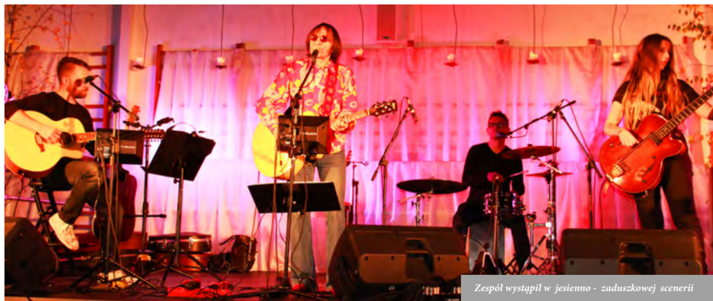
Zespół wystąpił w jesienno - zaduszkowej scenarii

Koncert został zorganizowany przez Parafię p.w. Św. Apostołów Szymona i Judy Tadeusza w Jaczowie, przy finansowym wsparciu gminy Jerzmanowa.