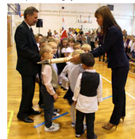
W SP w Jerzmanowej pasowanych na uczniów szkoły zostało 50 pierwszaków

w Jaczowie odbyła się Gala Nauczycielskich Talentów, podczas której wręczono m. in. tytuły Złotych Wykładowców. W Szkole Podstawowej w Jerzmanowej świętowano przyjęcie 6 i 7-latków w poczet społeczności szkolnej. Najpierw poddano ich próbie: pierwszaki wystąpiły przed publicznością, która gromkimi brawami zdecydowała o słuszności dyrektorskiej decyzji o pasowaniu ich na uczniów. W gimnazjum poprzez zabawne skecze i żarty poruszono tematy nauczycielskich bolączek, relacji z uczniami, trudnej sztuki dialogu pokoleń.