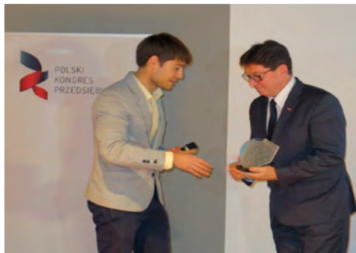
Wręczenie statuetki podczas gali w Łódzkiej Akademii Sztuk Pięknych

Gmina Jerzmanowa znalazła się w gronie 24 polskich samorządów, które zostały wyróżnione tytułem Lider Rozwoju Regionalnego 2015.