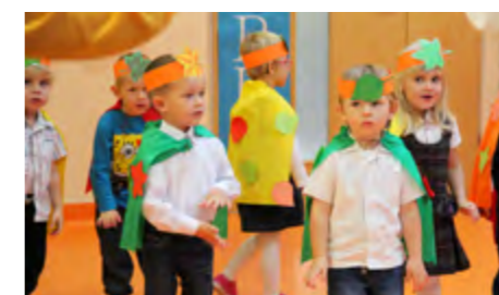
Kraina Marzeń rozbrzmiewała piosenkami grupy 3 - latków