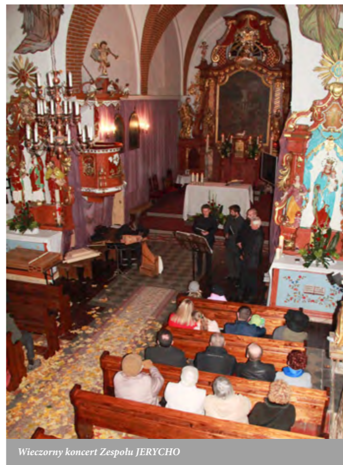
Wieczorny koncert Zespołu JERYCHO