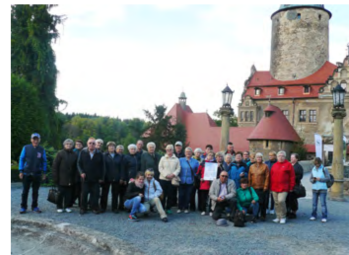
Uczestnicy wycieczki zwiedzili m.in. zamek Czocho

Organizacja wycieczki możliwa była dzięki środkom własnym gminy Jerzmanowa oraz wsparciu finansowemu Państwowego Funduszu Rehabilitacji Osób Niepełnosprawnych, pozyskanemu przez Powiatowe Centrum Pomocy Rodzinie. Galeria foto na stronie www.gopsjerzmanowa.pl