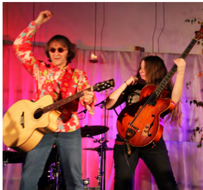
Walorem koncertu była muzyka grana na żywo

Zaduszkowy koncert pn. „PROJEKT KLENCZON. RETROSPEKCJA” wypełnił salę gimnastyczną w Jerzmanowej miłośnikami muzyki lat 70 i 80-tych. Przyszli całymi rodzinami, starsze i młodsze pokolenia by posłuchać znanego gitarzysty występującego w przeszłości m.in. z zespołem SOYKA YANINA i MAANAM.