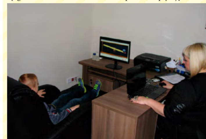
W terapii biofeedback uczestniczą uczniowie wszystkich szkół z terenu gminy

Niewątpliwym wyzwaniem edukacyjnym jest prowadzona w placówkach oświatowych terapia biofeedback, na którą Fundacja przekazała 23.000 zł. W znacznej części kwota ta przeznaczona została na zakup aparatury oraz wyposażenie gabinetu terapeutycznego. Pilotażowy program uruchomiony został we wrześniu br. a jego całkowity koszt to 39.100 zł. Terapię objęto 20 uczniów dyslektycznych, z o-