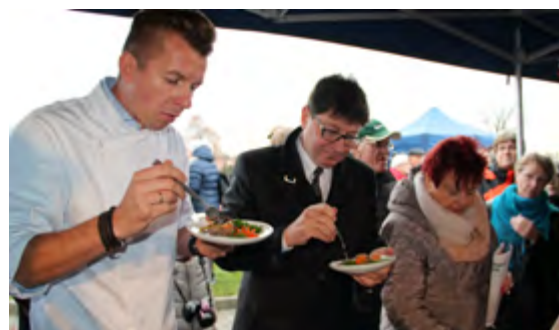
Jury konkursowe smakowało potrawy przygotowane przez sołectwa

Największą atrakcją imprezy był udział w niej Karola Okrasy , telewizyjnego autorytetu kulinarnego łamiącego przepisy.