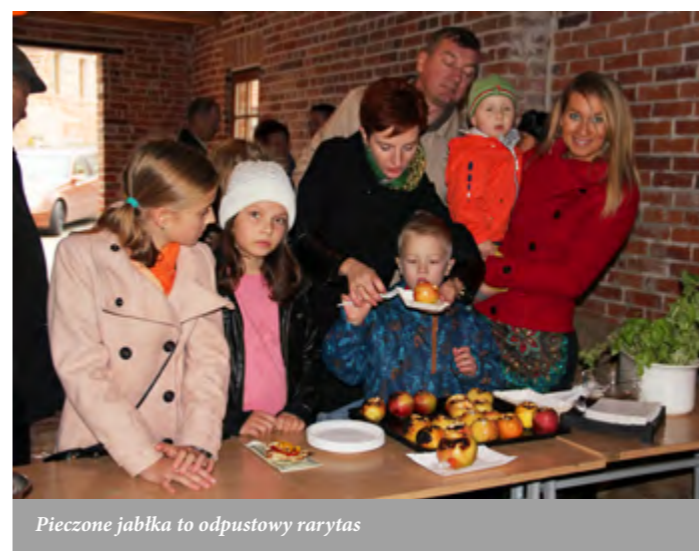
Pieczone jabłka to odpustowy rarytas

25 października br. obchodzono w Jaczowie parafialny odpust na cześć patronów św. Apostołów Szymona i Judy Tadeusza. Święto było kwintesencją dobrego smaku i wspaniałej muzyki wypełniających jesienny rytuał parafialny.