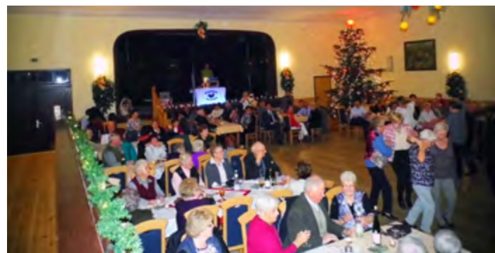
Spotkanie Seniorów cieszy się dużym zainteresowaniem i trwa dwa dni

uczestniczyły w poprzednich wyjazdach wracają do domów zawsze bardzo zadowolone. A wiadomo, informacje szybko się rozchodzą, to też w tym roku wyjazd cieszył się dużym zainteresowaniem.