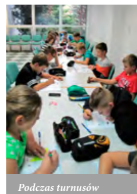
Podczas turnusów uczniowie realizują zajęcia przewidziane w programie nauczania