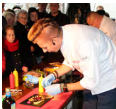
Występ dla publiczności zakończyła degustacja przygotowanych dań

Decyzja była bardzo trudna, bo przygotowane dania wszystkie nam smakowały, ale konkurs ma to do siebie, że wygrywa najlepszy – tłumaczył