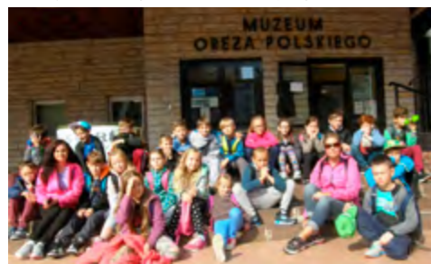
Uczniowie w Jaszowie podczas lekcji historii w Muzeum Oręża Polskiego w Ustroniu Morskim