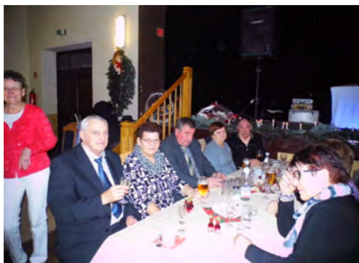
Dzień Seniora w Groß Rietz jest także doskonałą okazją do integracji wśród mieszkańców gminy Jerzmanowa