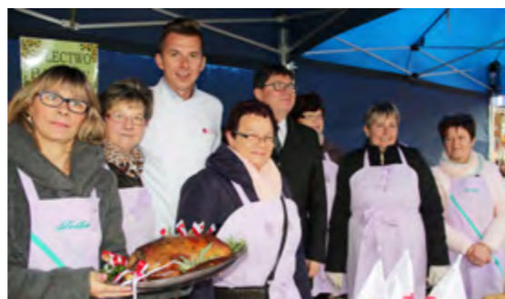
Wśród wyróżnionych w konkursie „Kulinarne Perły Gminy Jerzmanowa” znalazło się sołectwo Bądzów

Największą atrakcją imprezy był udział w niej Karola Okrasy , telewizyjnego autorytetu kulinarnego łamiącego przepisy.