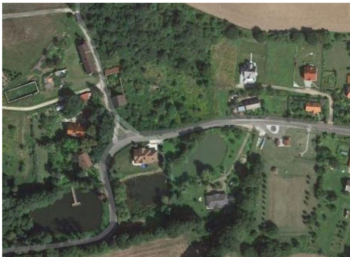
Widok z lotu ptaka