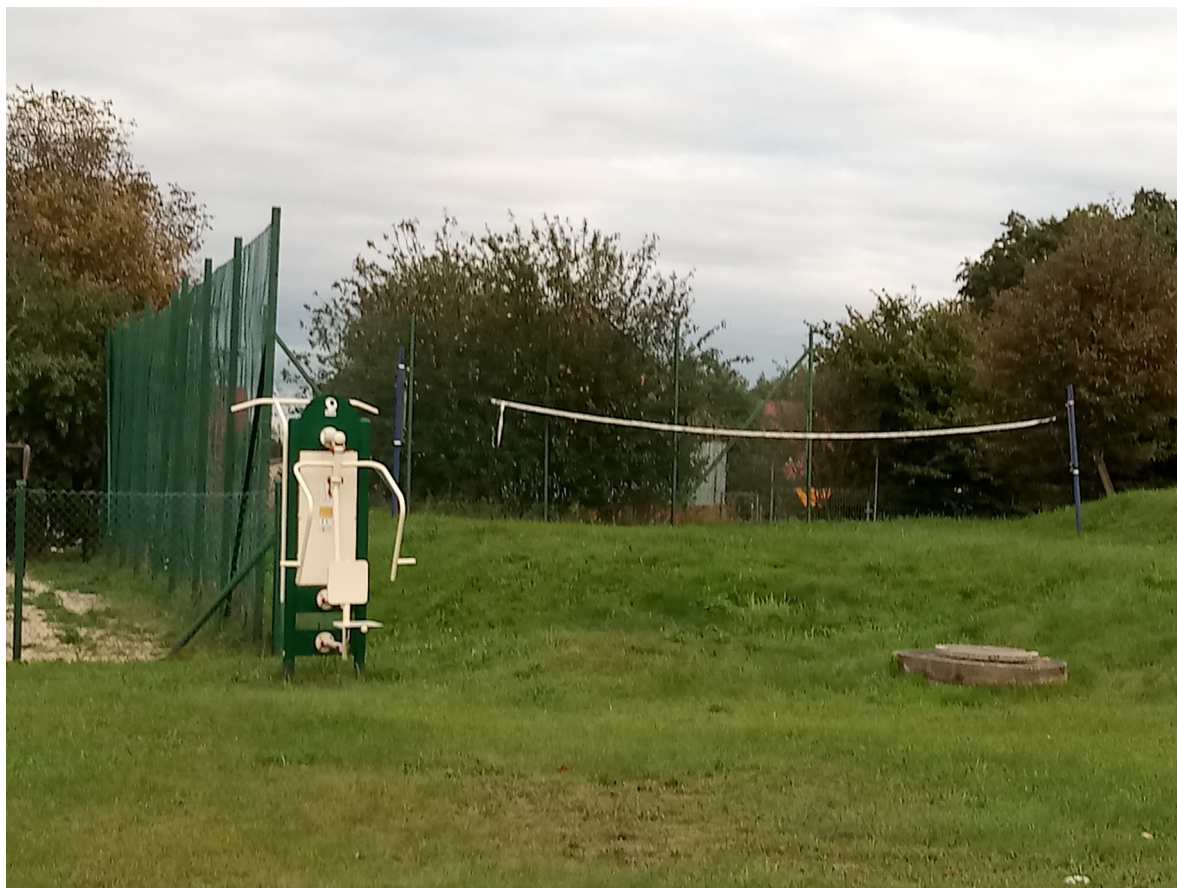
Boisko do piłki siatkowej