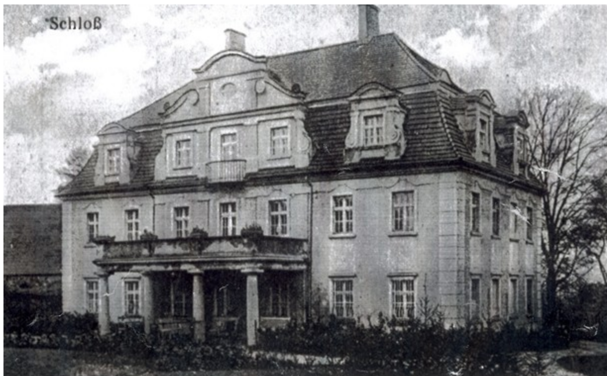
Pałac – zdjęcie sprzed 1945 r., dzisiaj zupełnie nie istnieje