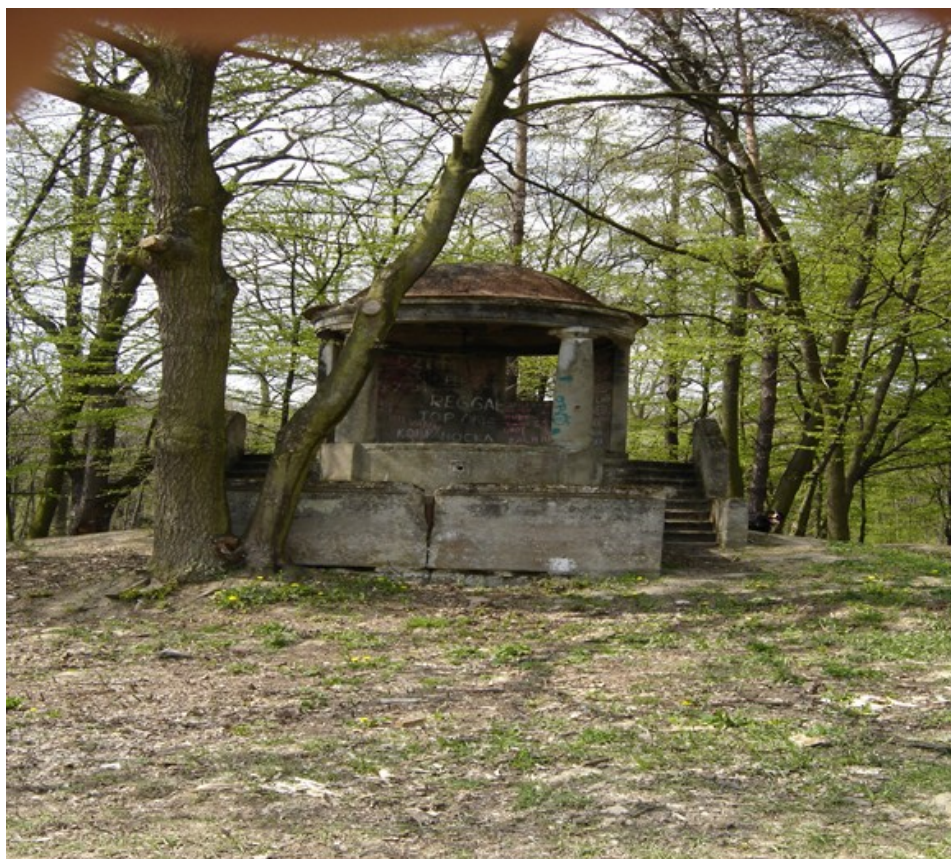
Altana widokowa wchodząca w skład zabudowań pałacowych